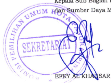
EFRY AL KHAUSAR