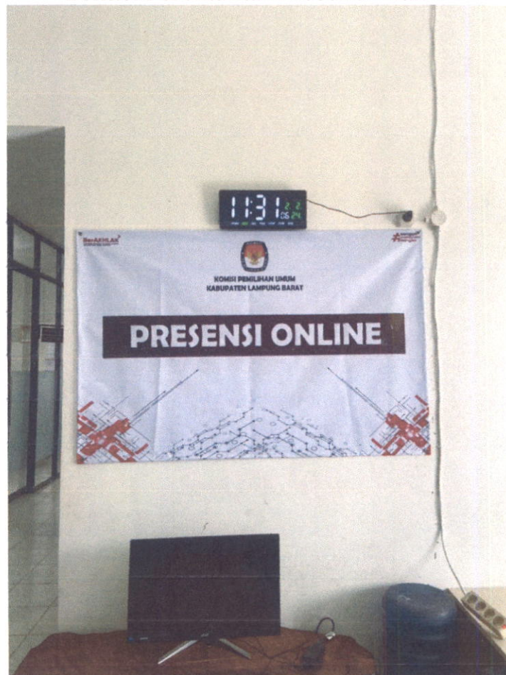
Lokasi Perekaman Presensi Titik 1