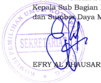
EFRY AL HAUSAR

Salinan sesuai dengan aslinya SEKRETARIAT KOMISI PEMILIHAN UMUM KOTA PANGKALPINANG Kepala Sub Bagian Hukum dan Sumber Daya Manusia,