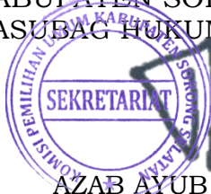
AZAB AYUB MOMOT

Salinan Sesuai dengan aslinya KOMISI PEMILIHAN UMUM KABUPATEN SORONG SELATAN KASUBAG HUKUM DAN SDM