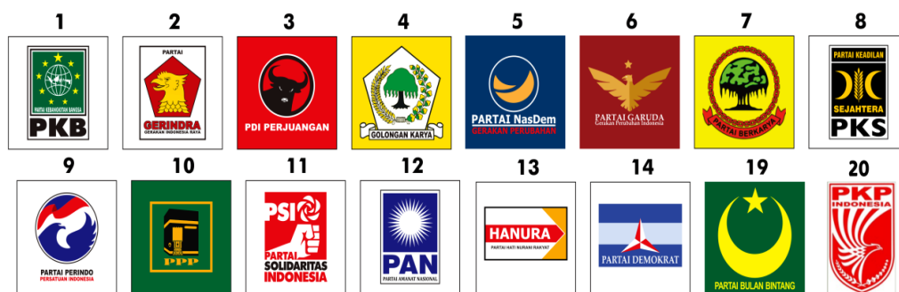
Gambar 1. Partai Politik Peserta Pemilu 2019 Kabupaten Mamberamo Tengah

Pemilu legislatif 2019 diselenggarakan pada tanggal 17 April 2019 dan diikuti oleh partai peserta Pemilu sebanyak 16 (enam belas) partai politik.