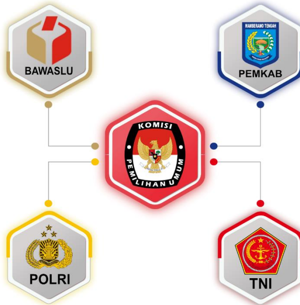
Gambar 3. Dinas dan Instansi yang bekerja sama dengan KPU Kabupaten Mamberamo Tengah BAB IV

Pemilihan Umum di Indonesia bersama Komisi Pemilihan Umum, adalah: 1). Bawaslu; 2). Pemerintah Daerah; 3). TNI; 4). POLRI.