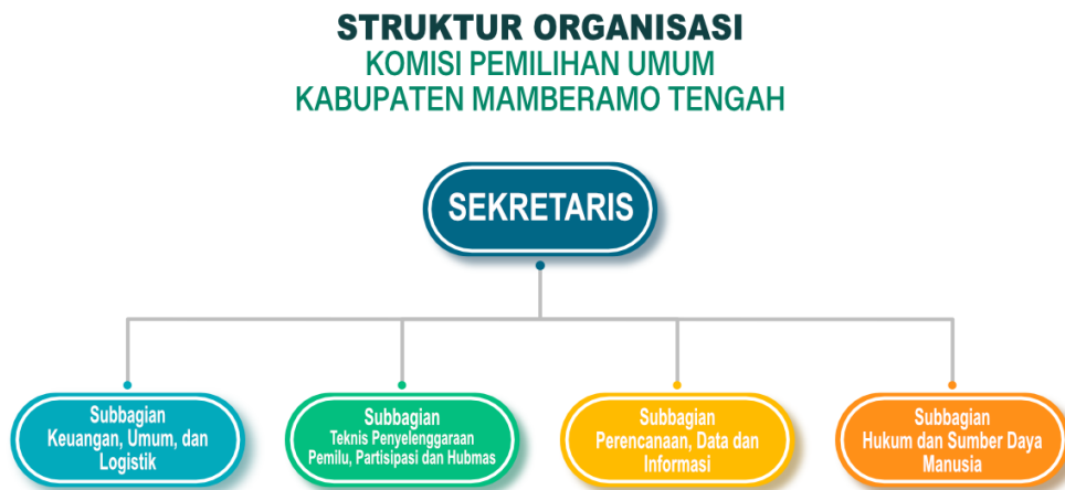
Gambar 2. Struktur Organisasi KPU Kabupaten Mamberamo Tengah

Susunan Organisasi Komisi Pemilihan Umum Kabupaten Mamberamo Tengah sebagaimana terdapat pada bagan dibawah ini.