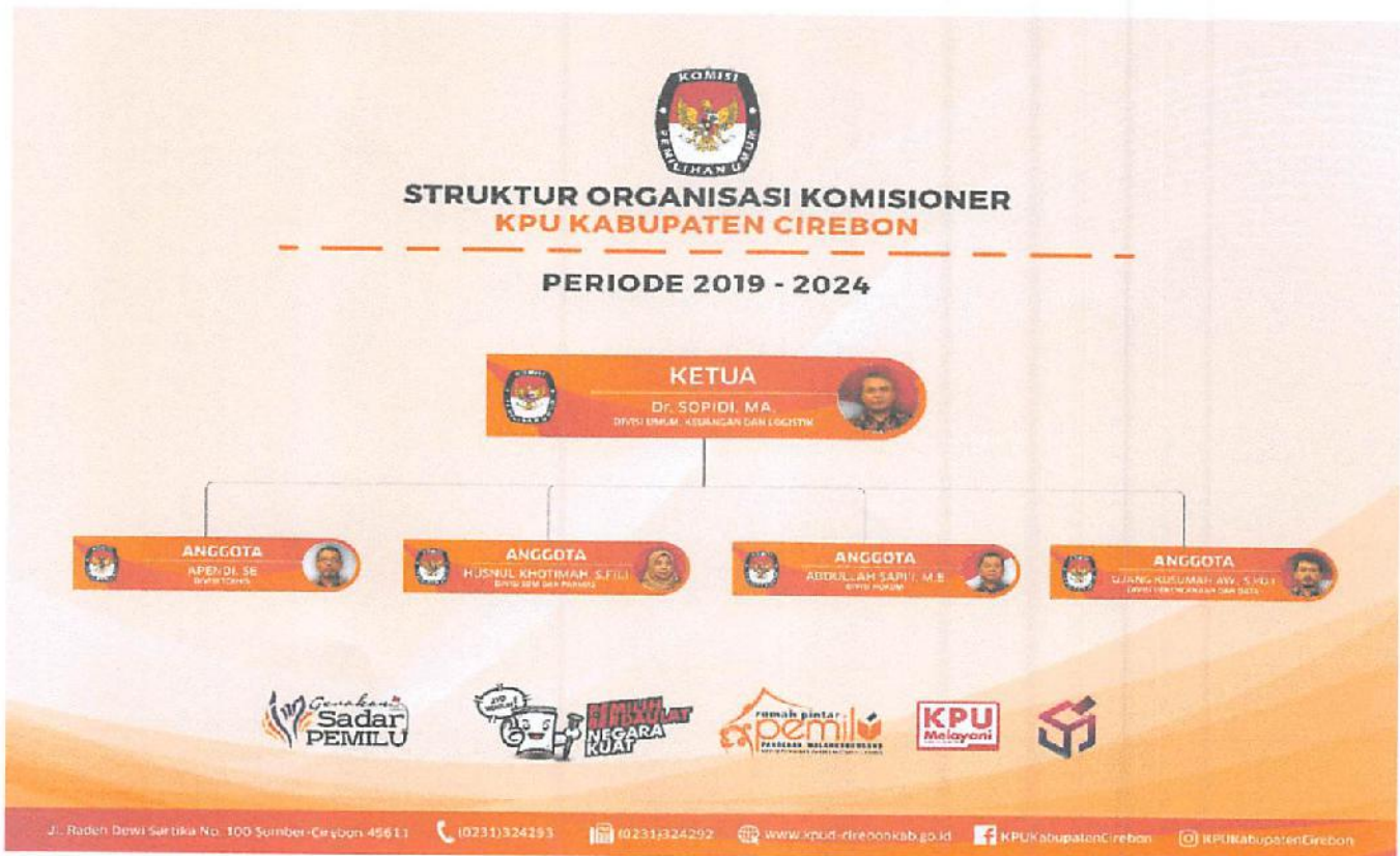
Gambar 1. Bagan Struktur Komisioner KPU Kabupaten Cirebon

Berdasarkan Peraturan Komisi Pemilihan Umum Nomor 06 Tahun 2008 tentang Susunan Organisasi dan Tata Kerja Sekretariat Jenderal Komisi Pemilihan Umum, Sekretariat Komisi Pemilihan Umum Provinsi, dan Sekretariat Komisi Pemilihan Umum Kabupaten/Kota sebagaimana telah diubah dengan Peraturan Komisi Pemilihan Umum Nomor 22 Tahun 2008 tentang Perubahan Peraturan Komisi Pemilihan Umum Nomor 06 Tahun 2008 tentang Organisasi dan Tata Kerja Sekretariat Jenderal Komisi Pemilihan Umum, Sekretariat Komisi Pemilihan Umum Provinsi, dan Sekretariat Komisi Pemilihan Umum Kabupaten/Kota. Susunan Organisasi dan Tata Kerja Komisi Pemilihan Umum Kabupaten Cirebon adalah sebagai berikut :