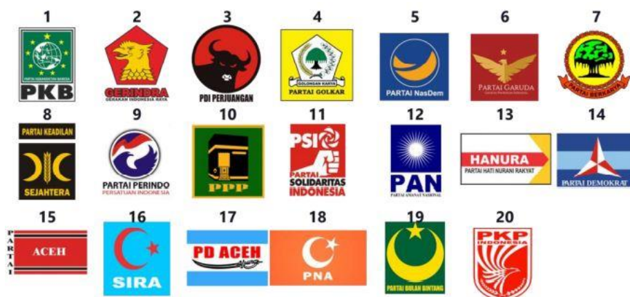
Gambar 1.2 Partai Politik Peserta Pemilu

Pemilu legislatif 2019 diselenggarakan pada tanggal 17 April 2019 dan diikuti oleh 20 (dua puluh) partai peserta Pemilu yang terdiri dari 16 (enam belas) partai nasional, 4 (empat) partai lokal.