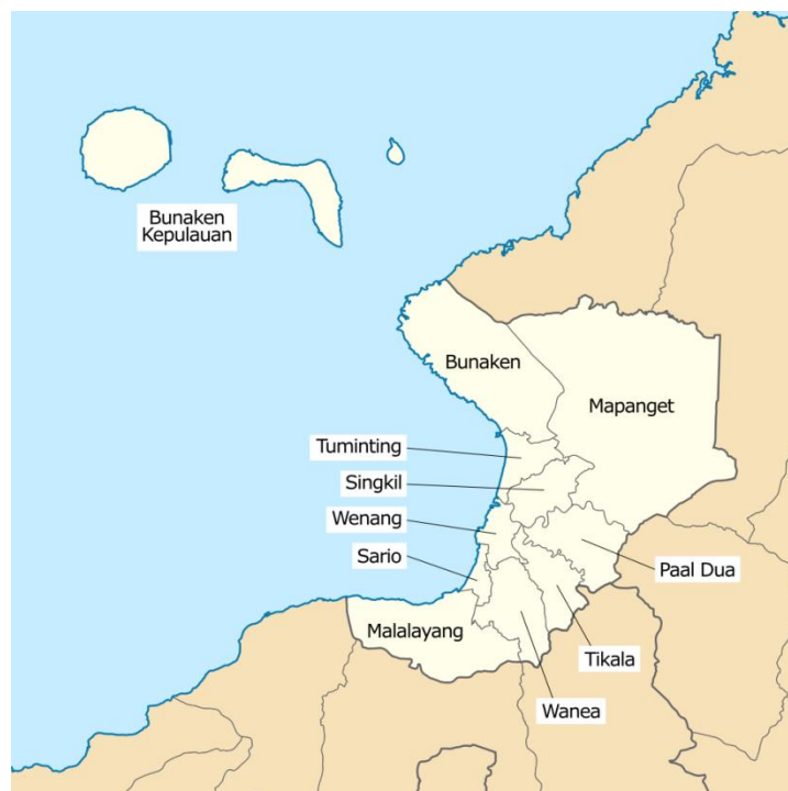
Gambar 1.1 Peta Kota Manado

Kota Manado adalah ibu kota dari provinsi Sulawesi Utara sekaligus merupakan kota terbesar yang ada di Sulawesi Utara. Kota Manado memiliki 11 (sebelas) Kecamatan dan 87 (delapan puluh tujuh) Kelurahan. Kota Manado berada pada posisi geografis 124°40' - 124°50' BT dan 1°30' - 1°40' LU. Kota Manado juga merupakan kota pantai yang memiliki garis pantai sepanjang 18,7 kilometer. Kota ini juga dikelilingi oleh perbukitan dan barisan pegunungan. Wilayah daratannya didominasi oleh kawasan berbukit dengan sebagian dataran rendah di daerah pantai.