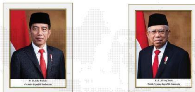
Gambar 1.3 Presiden dan Wakil Presiden Terpilih pada Pemilu 2019

Pada pemilihan Presiden Pemilihan Presiden-Wakil Presiden (Pilpres) 2019, KPU menetapkan pasangan calon Presiden dan Wakil Presiden Terpilih yaitu Ir. H. Joko Widodo dan Prof. Dr. (H.C) KH. Ma'ruf Amin pada Pemilu 2019 dengan Nomor 1185/PL.01.9-Kpt/06/KPU/VI/2019 berdasarkan putusan Mahkamah Konstitusi dengan Nomor 01/PHPU-PRES/XVII/2019 tanggal 27 Juni 2019 dengan perolehan suara sebanyak 85.607.362 atau 55,50% dari total suara sah Nasional.