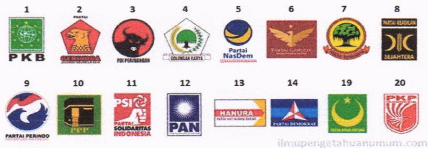
Gambar 1 Partai Politik Peserta Pemilu 2019

Pemilu Legislatif 2019 KPU Kabupaten Muna menetapkan Daftar Pemilih Tetap Hasil Perbaikan Ketiga berjumlah 145.594 pemilih dengan rincian pemilih laki-laki berjumlah 69.619 pemilih dan pemilih perempuan berjumlah 75,975 pemilih yang tersebar di 22 Kecamatan, 150 Desa/Kelurahan, dan 624 TPS.