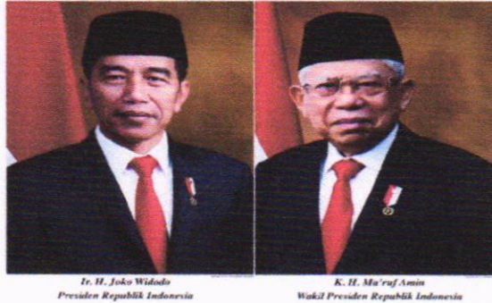
Gambar 3. Presiden dan Wakil Presiden Terpilih pada Pemilu 2019

berdasarkan putusan Mahkamah Konstitusi dengan Nomor : 01/PHPU-PRES/XVII/2019 tanggal 27 Juni 2019 dengan perolehan suara sebanyak 85.607.362 atau 55,50% dari total suara sah Nasional.