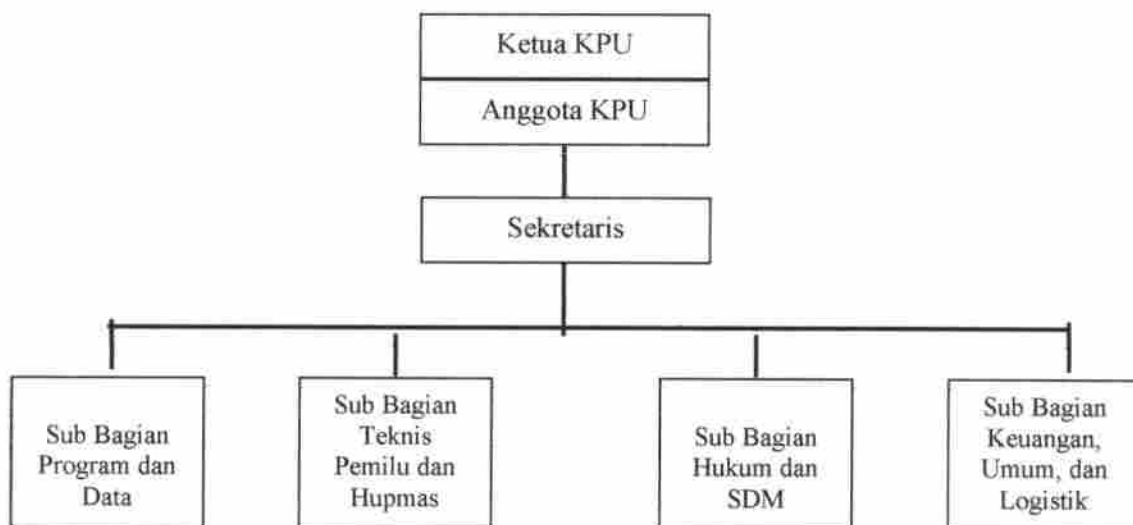
Gambar 3. Bagan Organisasi Komisi Pemilihan Umum Kabupaten Gianyar

Dalam melaksanakan tugas dan kewenangannya, Komisi Pemilihan Umum Kabupaten/Kota didukung oleh Sekretaris Komisi Pemilihan Umum Kabupaten/Kota yang telah diatur tugas wewenang dan kewajibannya dalam peraturan perundang-undangan. Secara struktural, Sekretaris Komisi Pemilihan Umum Kabupaten Gianyar menjalankan tugas dan fungsinya dibantu oleh 4 (empat) Kepala Sub Bagian. Berdasarkan Peraturan Komisi Pemilihan Umum Nomor 6 Tahun 2008 struktur organisasi Sekretariat Komisi Pemilihan Umum Kabupaten/Kota adalah sebagai berikut: