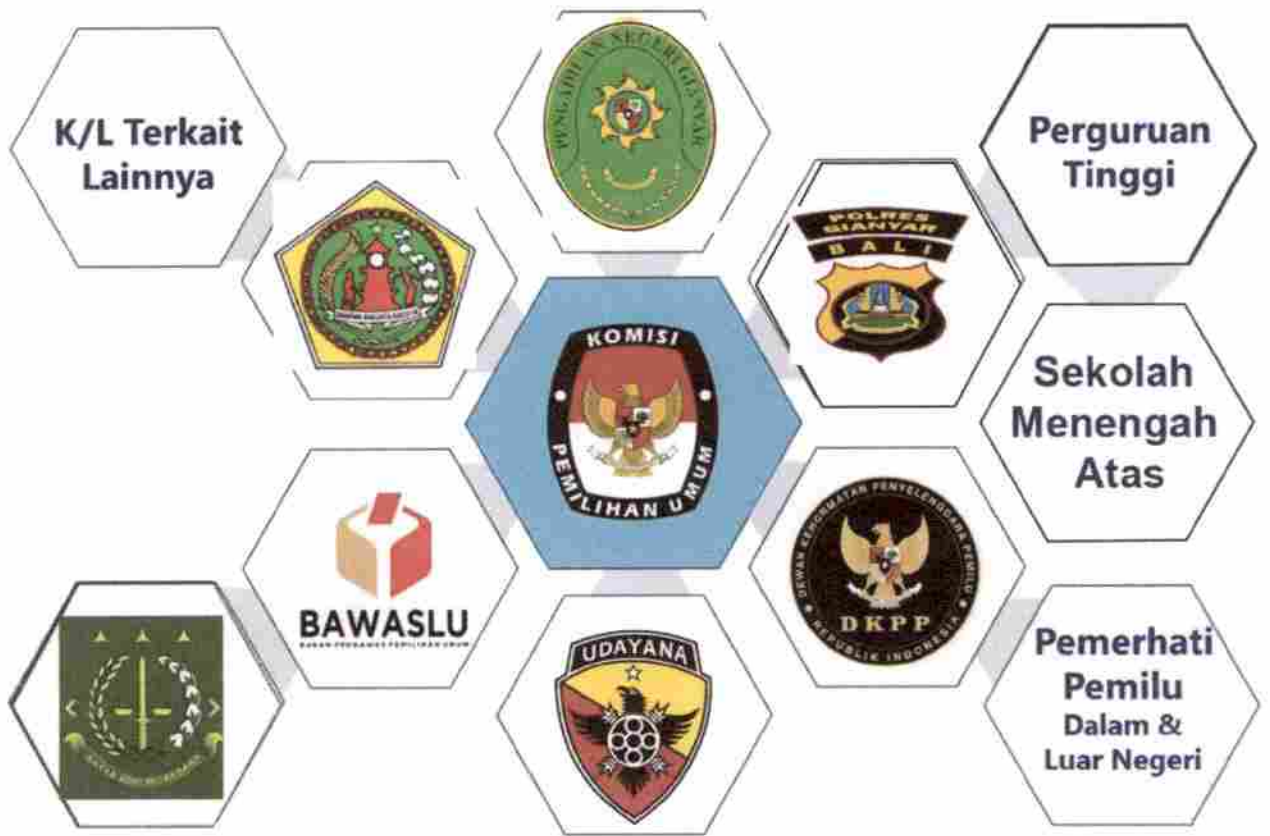
Gambar 5. Kerjasama antar Lembaga Mendukung Pelaksanaan Pemilu/ Pemilihan