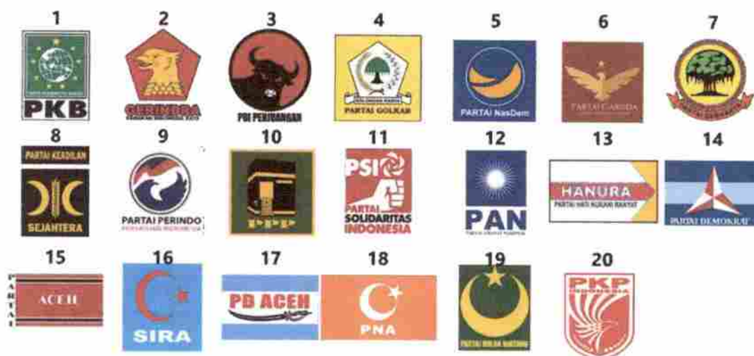
Gambar 1. Partai Politik Peserta Pemilu 2019

Pemilu legislatif 2019 diselenggarakan pada tanggal 17 April 2019 dan diikuti oleh 20 (dua puluh) partai peserta Pemilu yang terdiri dari 16 (enam belas) partai nasional, 4 (empat) partai lokal.