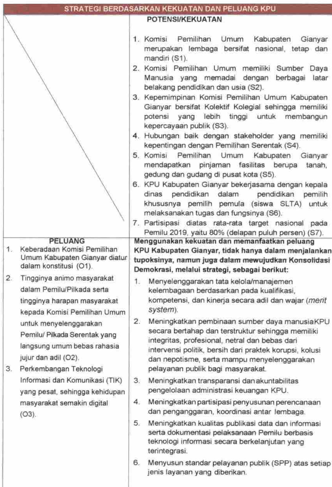
Tabel 10. Perumusan Strategi Berdasarkan Kekuatan vs Peluang KPU