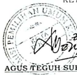
AGUS TEGUH SURYAMAN. SH,SKH Wt