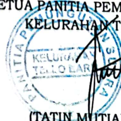
(TATIN MUTIARA INDAH P)

a.n. KETUA KOMISI PEMILIHAN UMUM KOTA MAKASSAR, KETUA PANITIA PEMUNGUTAN SUARA KELURAHAN TELLO BARU,