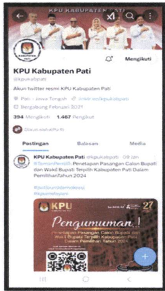
Akun X : @kpukabpati