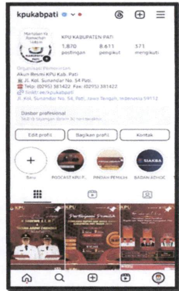
Akun IG : @kpukabpati