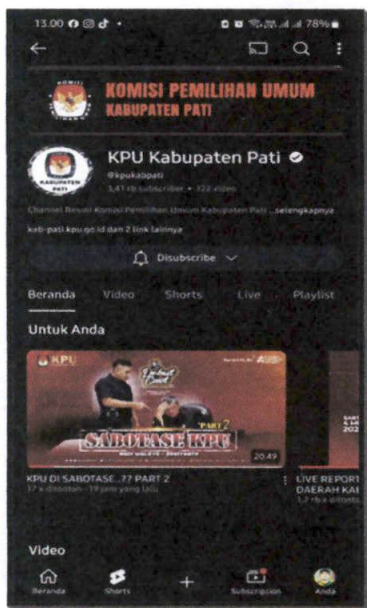
Akun YouTube : KPU Kabupaten Pati