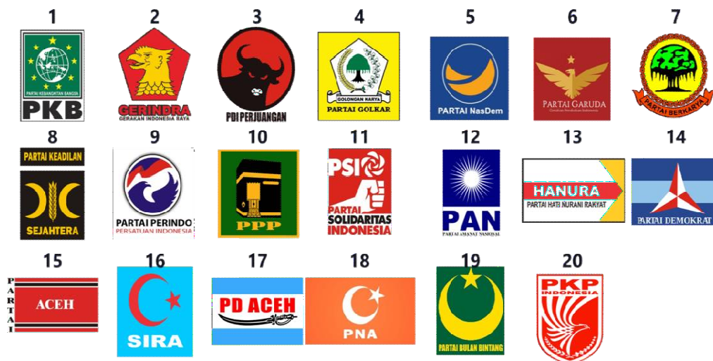
Gambar 1 Partai Politik Peserta Pemilu 2019 yang ada di Kab.OKU

Pemilu legislatif 2019 diselenggarakan pada tanggal 17 April 2019 dan diikuti oleh 20 (dua puluh) partai peserta Pemilu yang terdiri dari 16 (enam belas) partai nasional, 4 (empat) partai lokal. Pada Kabupaten Ogan Komering Ulu sendiri ada 16 Partai Nasional yang ada di wilayah Kabupaten Ogan Komering Ulu.