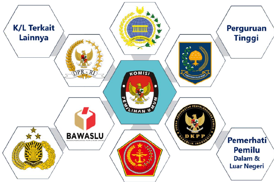
Gambar 9 Kerjasama antar Lembaga Mendukung Pelaksanaan Pemilu