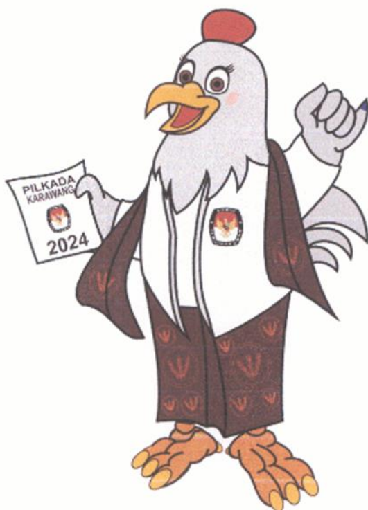
CIPA (Ciptakan Pilkada Aman)