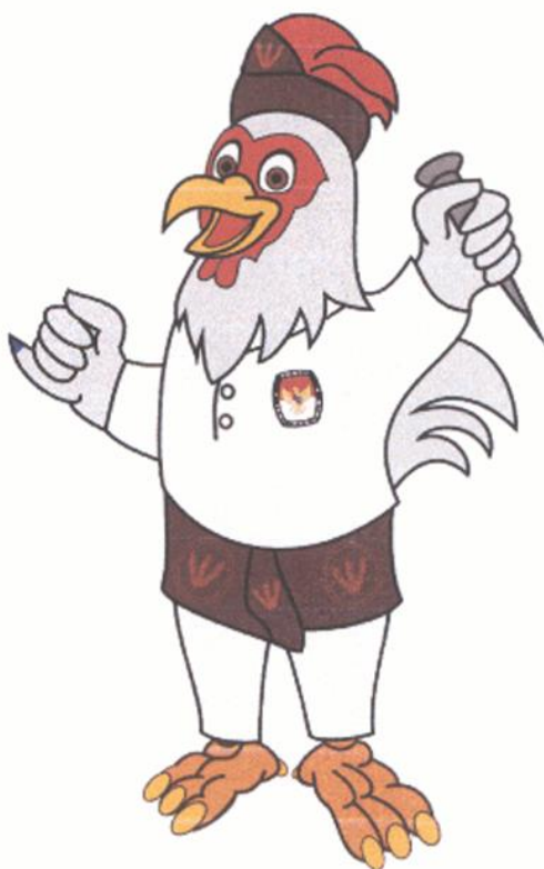
RAGE (Rakyat Gembira)

Salinan sesuai dengan aslinya SEKRETARIAT KOMISI PEMILIHAN UMUM KABUPATEN KARAWANG Plt. Kepala Sub Bagian Hukum dan SDM,