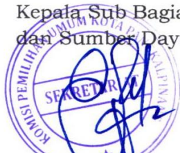
EFRY AL RKAUSAR

Salinan sesuai dengan aslinya SEKRETARIAT KOMISI PEMILIHAN UMUM KOTA PANGKALPINANG Kepala Sub Bagian Hukum dan Sumber Daya Manusia,