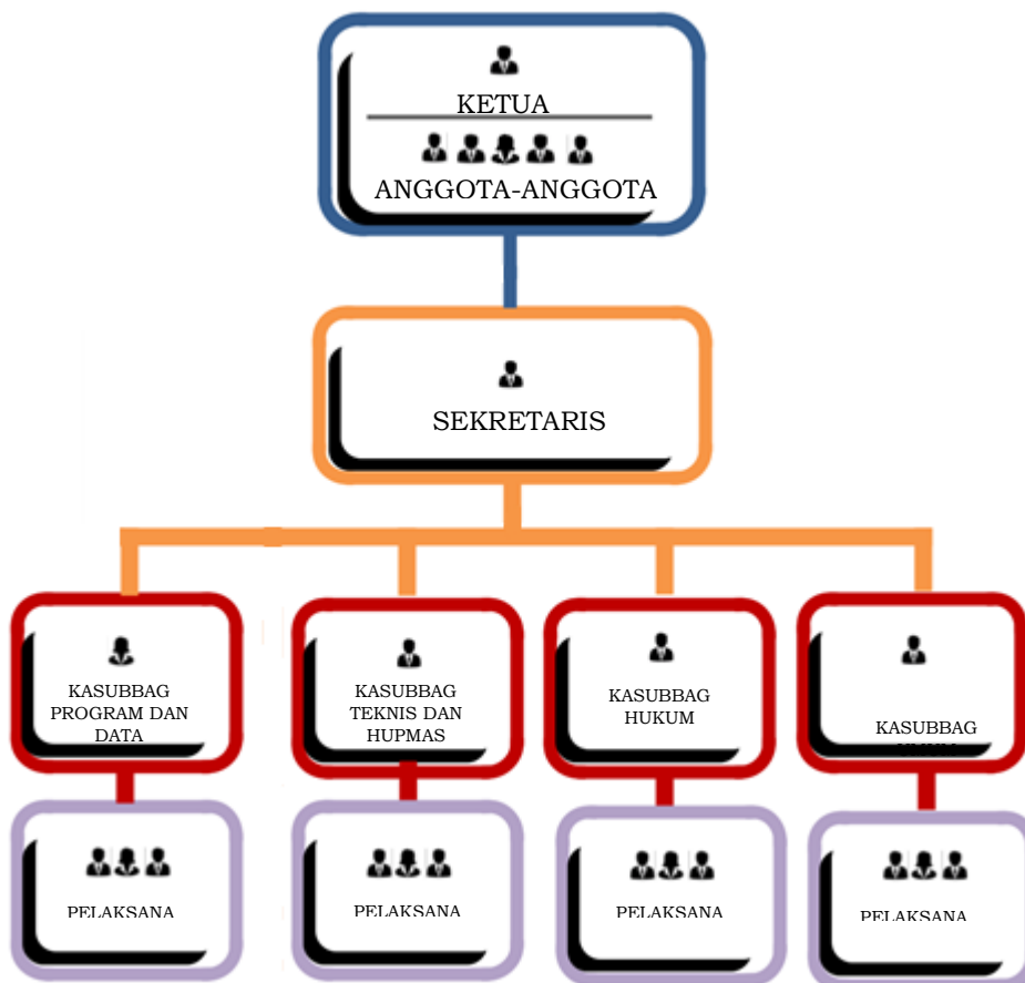
Gambar 1.1 Struktur Organisasi KPU Kabupaten Tebo