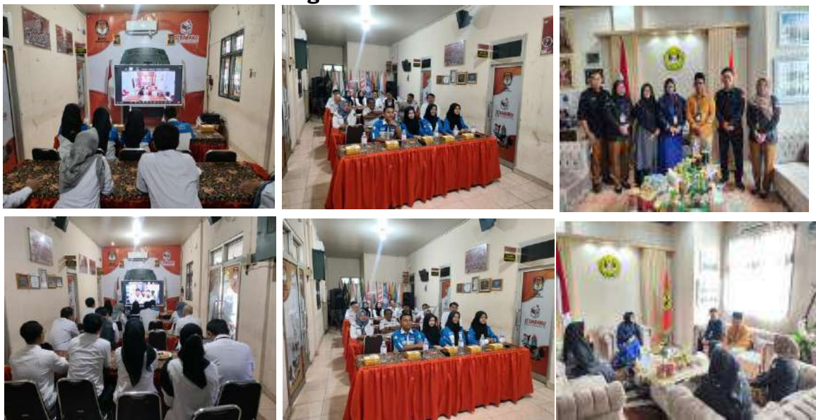
Gambar 3.5. Kegiatan Webminar dan Audiensi Unbara