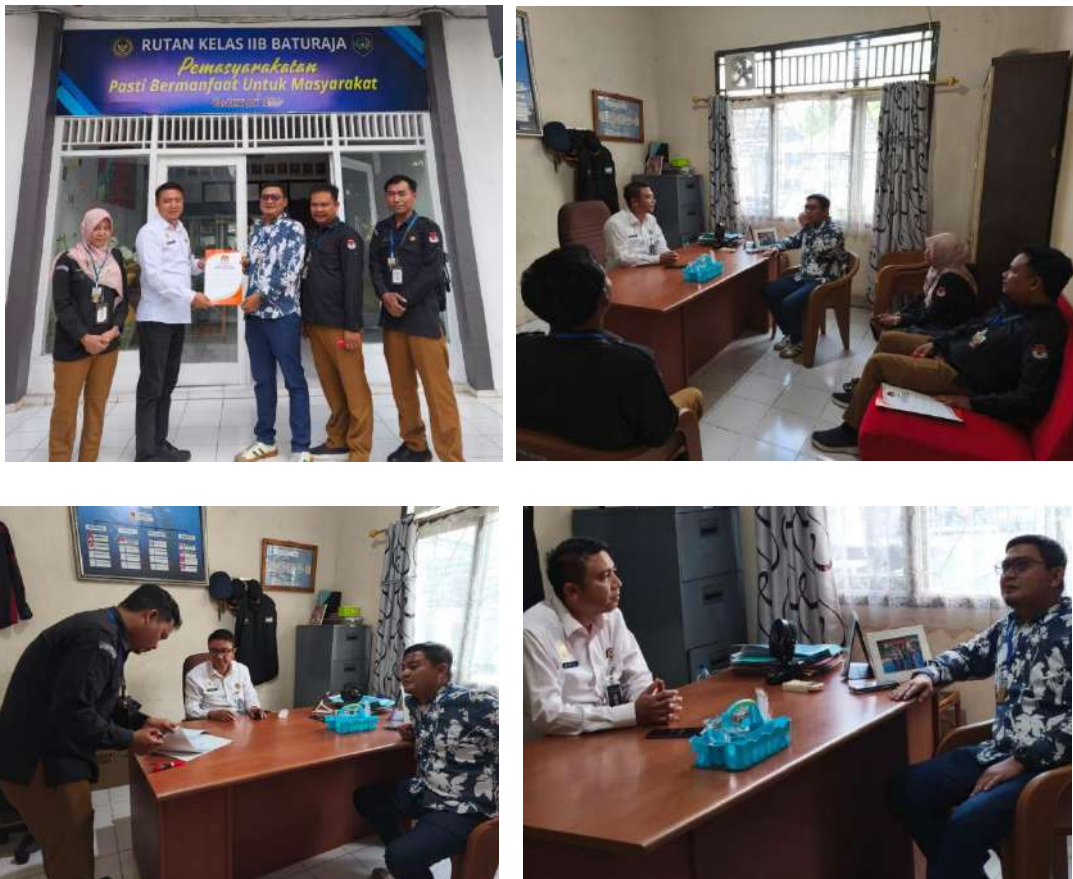
Gambar 3.10. Koordinasi ke Rutan Kelas II.B