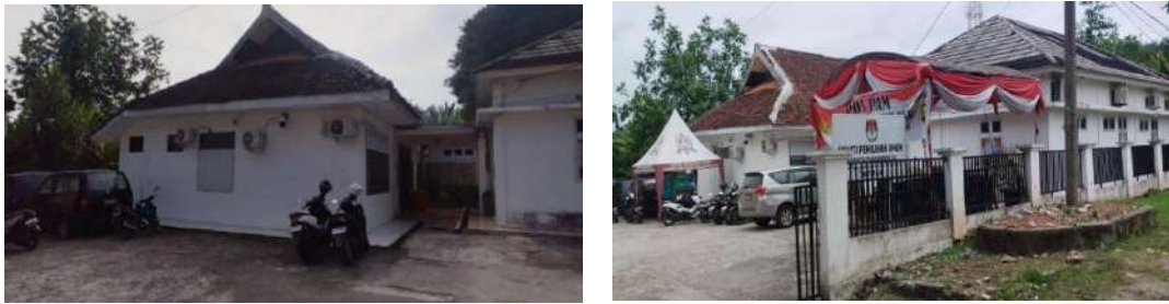
Gambar 1.1. Kantor KPU Ogan Komering Ulu