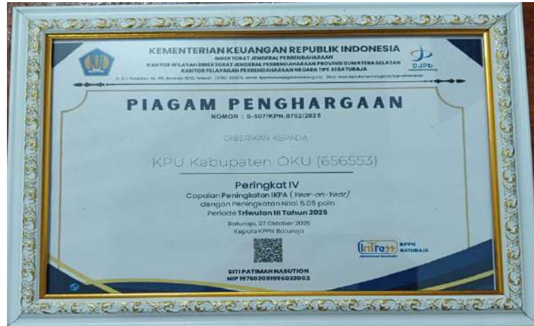
Gambar 3.15. Piagam Peningkatan IKPA

2. Komisi Pemilihan Umum Kabupaten Ogan Komering Ulu menerima Penghargaan dari KPU Propinsi Sumatera Selatan sebagai Kinerja Terbaik dalam Penyelesaian PDPB tahun 2025.