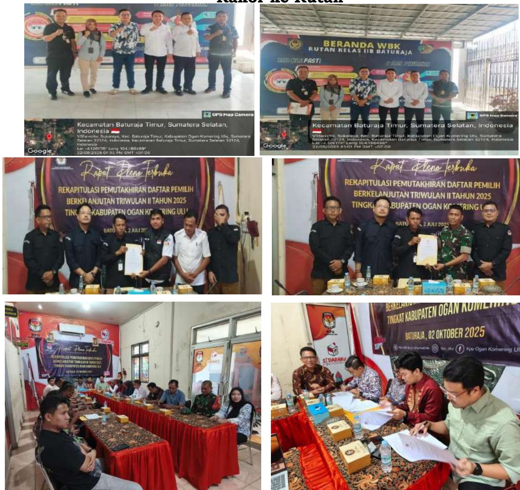
Gambar 3.6. kegiatan Rapat Pleno PDB TW II, III, IV, Coklit dan Rakor ke Rutan