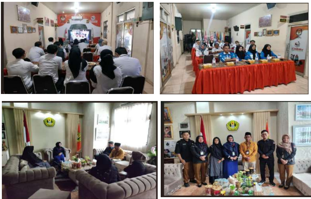
Gambar 3.4. Kegiatan Sosialisasi