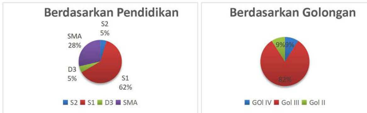
Gambar 1.2. Diagram