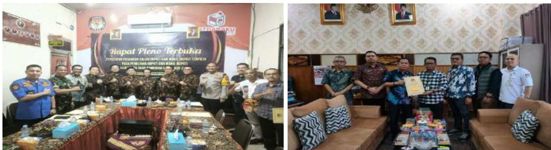
Gambar 3.1 Rapat pleno terbuka penetapan calon terpilih dan penyerahan berkas calon terpilih ke DPRD Kab.OKU