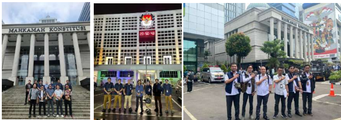
Gambar 3.1. Sidang MK