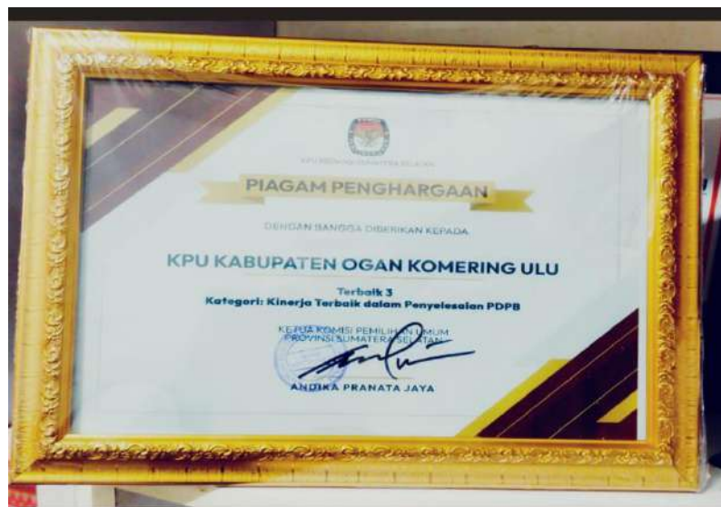
Gambar 3.14. Piagam Kinerja Terbaik PDPB