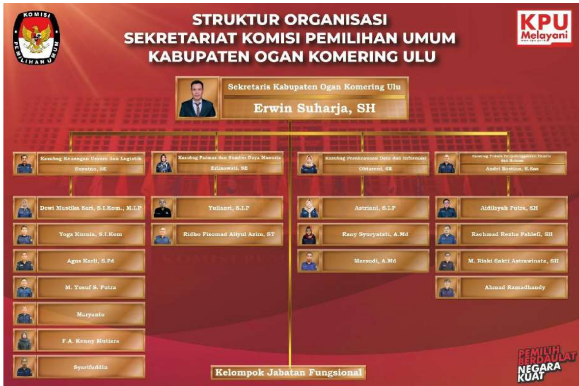
Gambar 1.3. Struktur Organisasi KPU Kabupaten Ogan Komering Ulu

Struktur organisasi yang berlaku pada KPU Kabupaten Ogan Komering Ulu ditampilkan pada gambar di bawah ini :