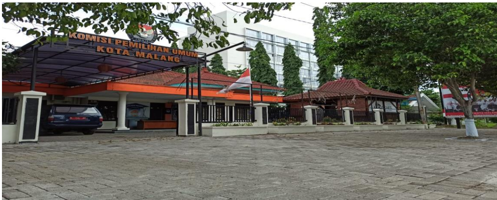
Gambar 1 Kantor KPU Kota Malang

Kantor KPU Kota Malang yang terletak di Jalan Bantaran No.6 Malang Kelurahan Purwodadi Kecamatan Blimbing Kota Malang, menempati bangunan seluas 625 m 2 milik Pemerintah Kota Malang. Status lahan dan bangunan yang ditempati tersebut merupakan pinjam pakai dari Pemerintah Kota Malang.