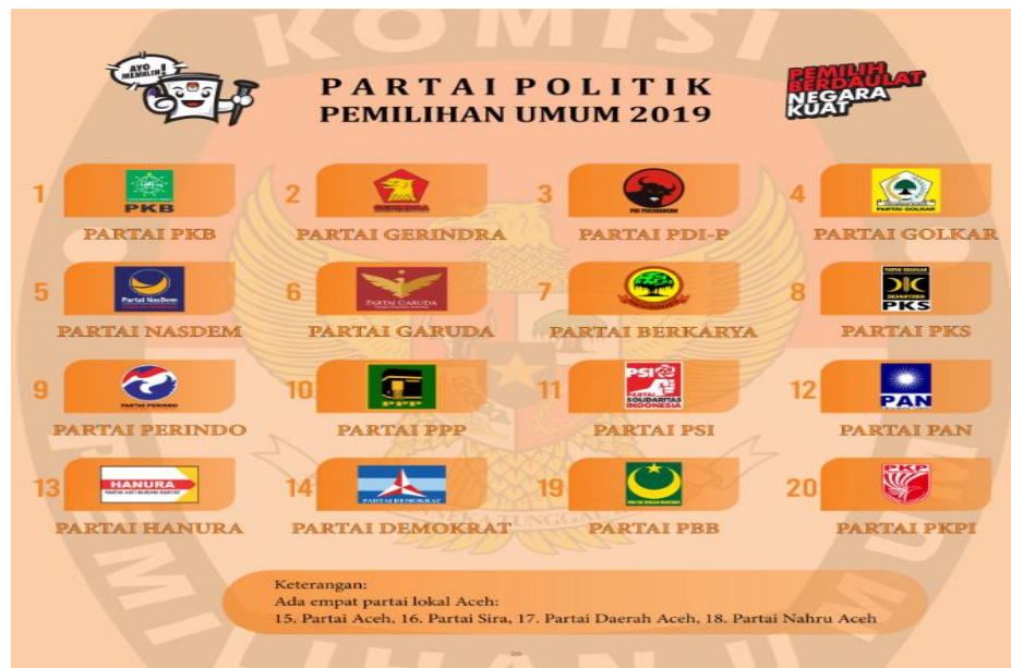
Gambar 2 Partai Politik Peserta Pemilu 2019

Pemilu legislatif 2019 di Komisi Pemilihan Umum Kota Malang yang diselenggarakan pada tanggal 17 April 2019 diikuti oleh 16 (enam belas) partai peserta Pemilu dengan nomor urut Partai Politik :